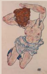
Egon Schiele, Femme Tombant , crayon/aquarelle/gouache sur papier, 46,3x29,5cm. 1917.